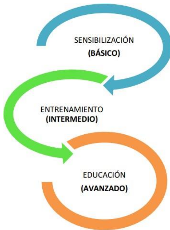
Ilustración 2. Plan de Sensibilización del PETI

A continuación, se muestra como se entrelazan estratégicamente el plan de sensibilización, entrenamiento y educación para lograr los objetivos trazados en el presente Plan de Comunicación del PETI: