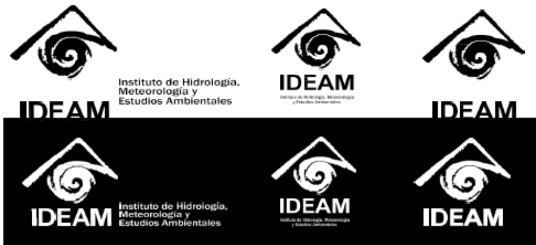
Imagen 6. Versiones Monocromáticas.