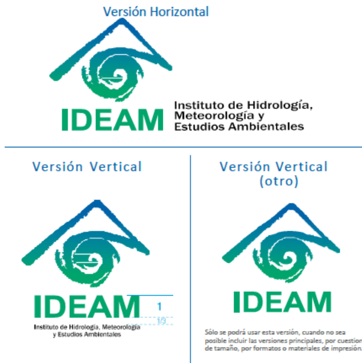
Imagen 1. Logotipo del IDEAM