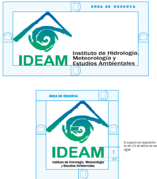
Imagen 2. Área de Reserva