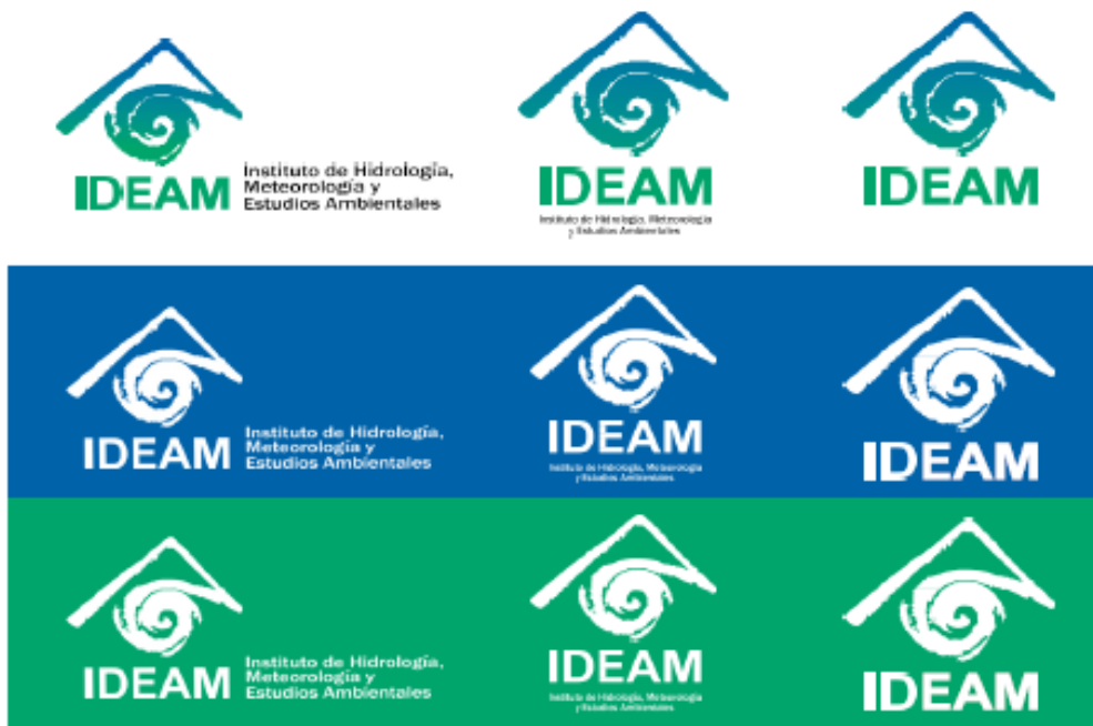
Imagen 5. Versiones de Color.

versión positiva: el logotipo se reproduce sobre fondo blanco. En su versión negativa, el logotipo se reproduce en blanco sobre fondo en color.