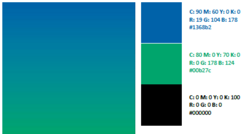
Imagen 4. Colores.