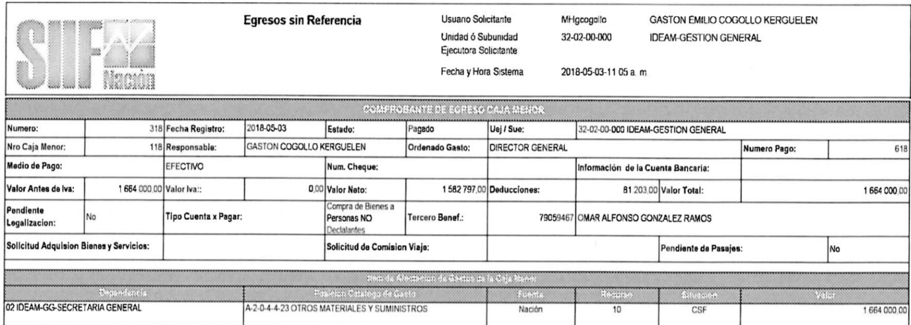
Imagen Reporte Egresos - SIIF